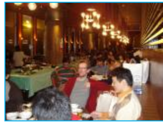
上位のほか飛び賞や抽選での賞品も多数！